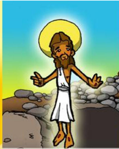
1° ESTACIÓN: JESÚS RESUCITADO