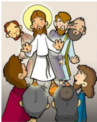
6° ESTACIÓN: JESÚS MUESTRA SUS LIAGAS EN EL CENÁCULO