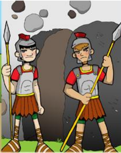
4° ESTACIÓN: LOS SOLDADOS VIGILAN EL SEPULCRO VACÍO