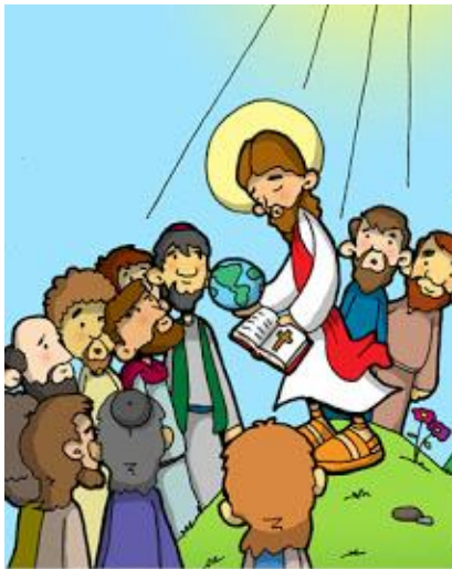
12º ESTACIÓN: JESÚS DEJA LA MISIÓN DE EVANGELIZAR