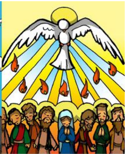
14º ESTACIÓN: PENTECOSTÉS