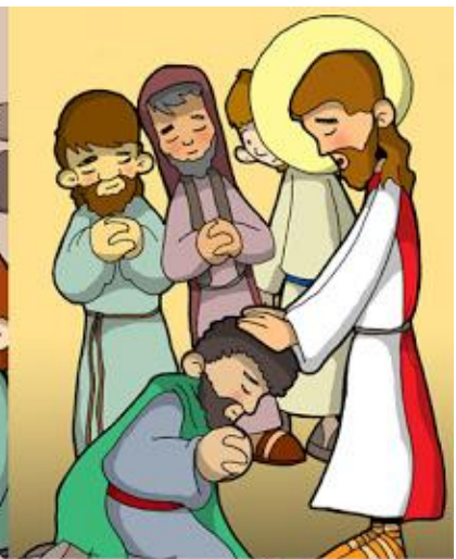
8° ESTACIÓN: JESÚS DA A LOS APOSTOLES EL PODER DE PERDONAR LOS PECADOS