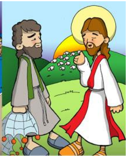
11º ESTACIÓN: JESÚS CONFIRMA A PEDRO EN EL AMOR