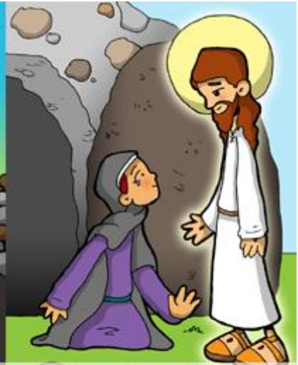
2° ESTACIÓN: JESÚS SE APARECE A MAGDALENA