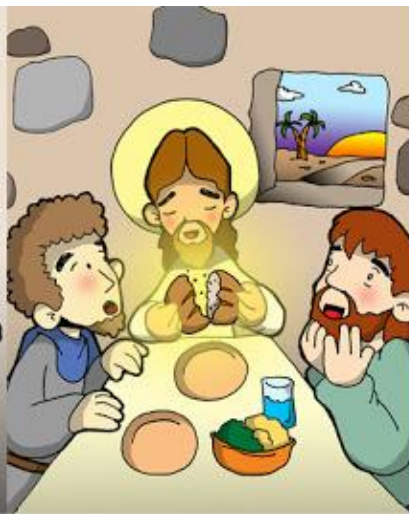
7° ESTACIÓN: EL CAMINO A EMAÚS