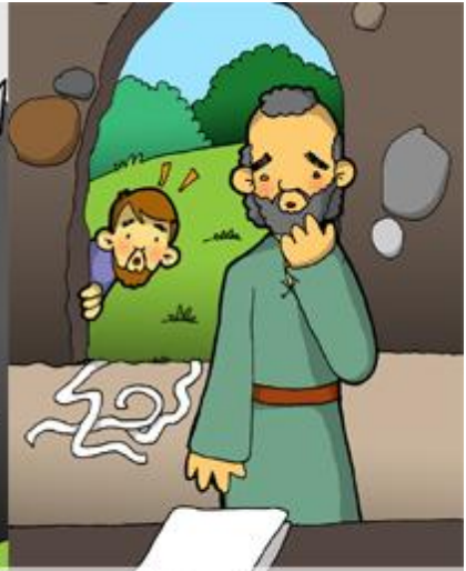
5° ESTACIÓN: PEDRO Y JUAN LLEGAN AL SEPULCRO VACÍO