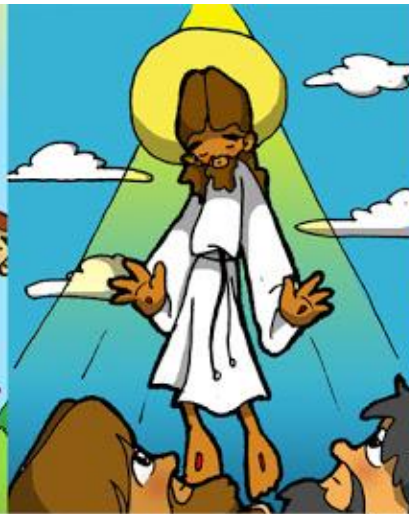
13º ESTACIÓN: JESÚS ASCIENDE A LOS CIELOS