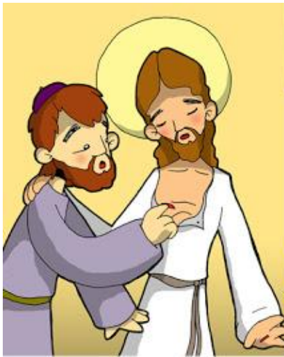
9º ESTACIÓN: JESÚS FORTALECE LA FE DE TOMÁS